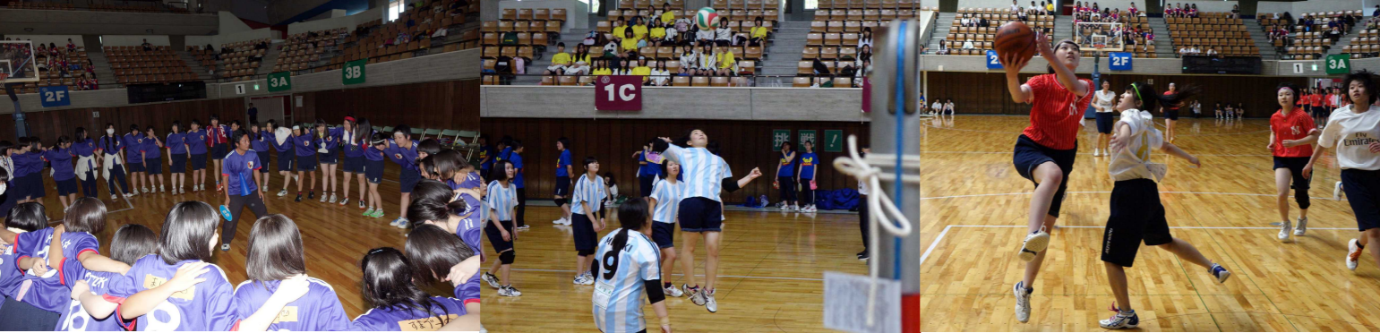
総合優勝の3A。担任の先生を中心に円陣！ バレーボール 生徒会長のスパイク！ バスケットボール 今日真剣勝負！

7月15日（金）～20日（水）に校内球技大会が行われました。最終日は県立体育館で卓球、バドミントンから始まり、バレーボール、バスケットボールの熱戦が繰り広げられました。競技・応援と、全校が盛り上がった3日間でした。