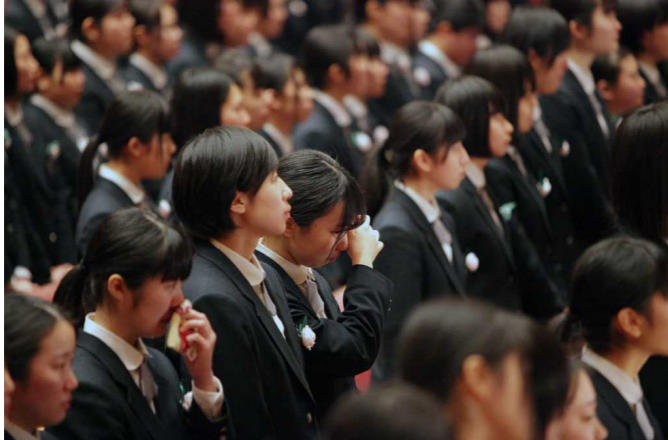
思いがあふれる涙

毎年本校の卒業式を行ってきた秋田県民会館は、新しい総合文化施設の建設のため、今年5月いっぱい閉館します。57年の歴史を持つホールでの最後の式典はとて感動的なものとなりました。