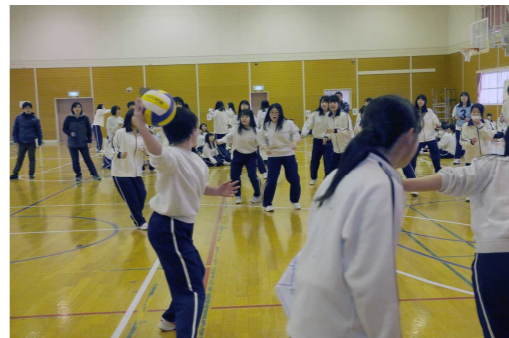
迫力の投球…！ドッジボール