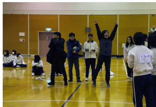
担任の先生も必死の対決