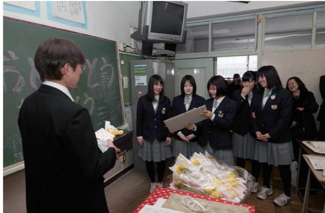
担任の先生に「感謝状」を贈呈