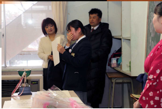
卒業証書を手に涙の挨拶