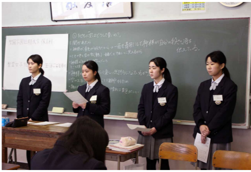
面接のテーマについて考えます

今年は企画運営を3年生に考えてもらい、分野ごとに違う教室で行うことになりました。保育のグループでは「子どもに『どうして空は青いの?』と聞かれたらどう答えるか?」という、今年出題された面接テーマを一緒に考えていました。他にもクイズ形式にしたり、個別相談を設けたり…。実際に進路活動を経験したからこそ、後輩たちが知りたいことや今必要なことが分かるんですね。3年生・2年生両者にとって良い会になったようです。