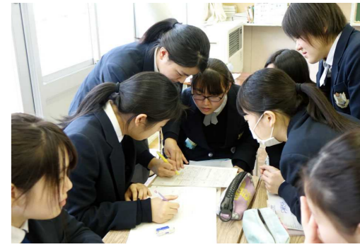
求人票の見方について説明