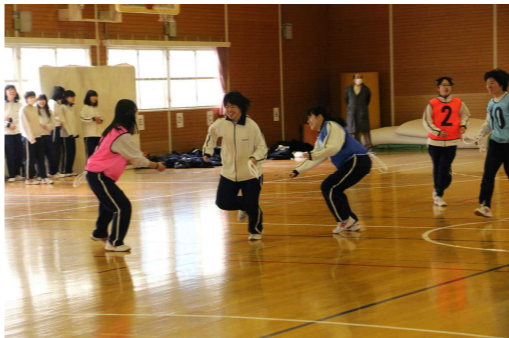
しっぽとり競争…楽しそうです

各クラス、優勝を目指して精一杯がんばりました。間もなく3年生になり、進路についての準備が本格的になりますが、この時だけはそんなことを忘れて思いっきり動いて声を出し、クラスの団結力を高めていました。